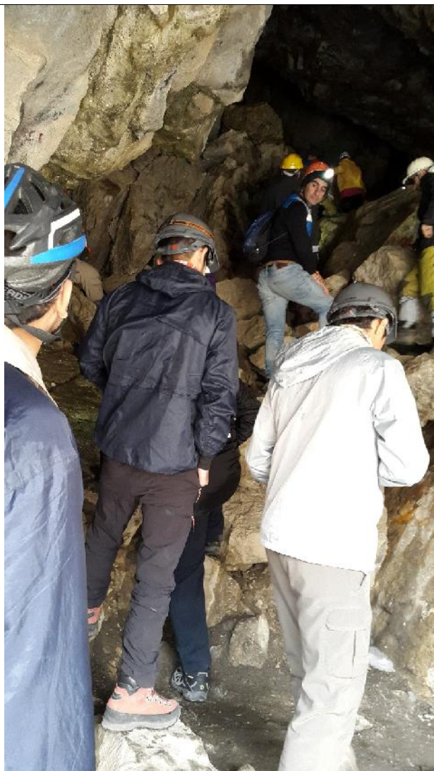
عکس شماره ۸: ورودی غار