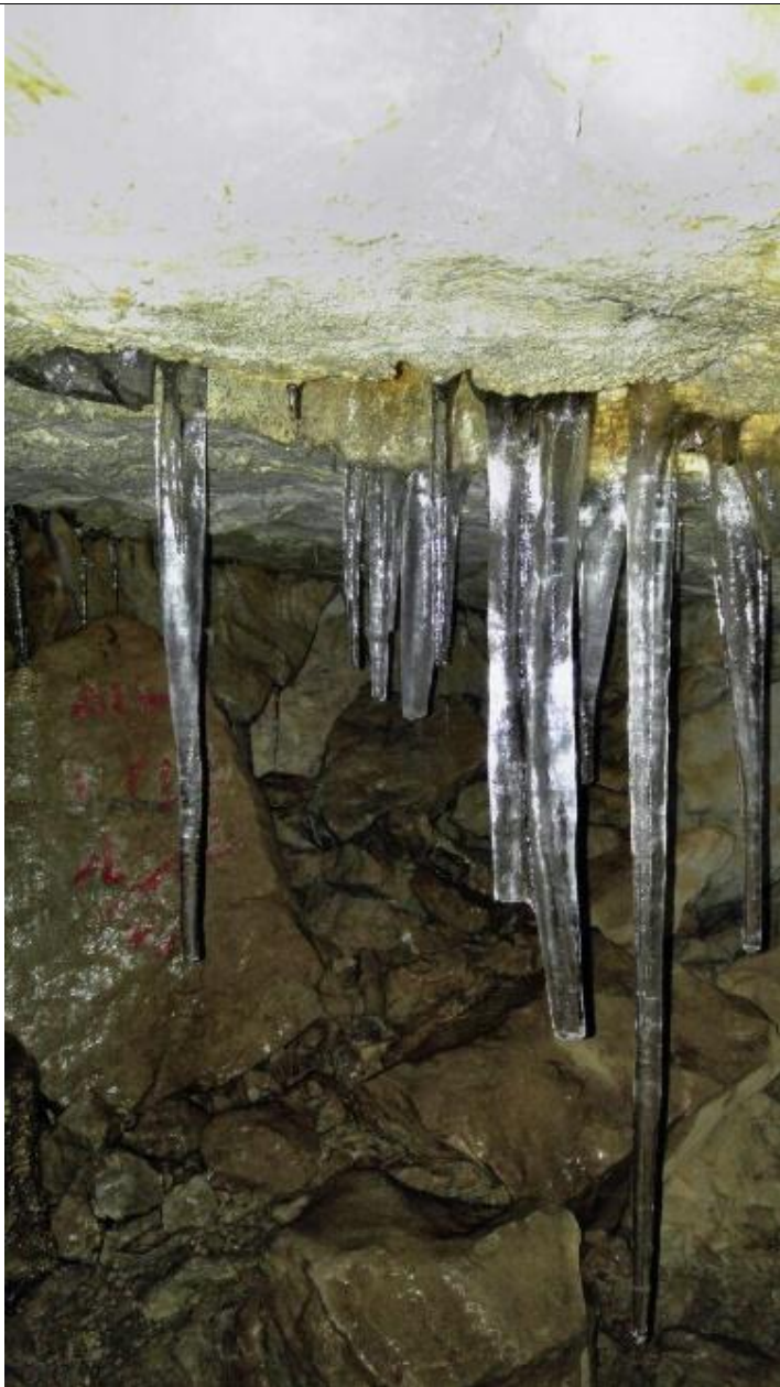
عکس شماره ۲: نمونه ای از قندیل های فراوان غار