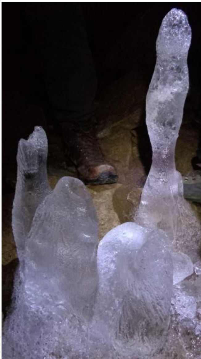
عکس شماره ۳: نمونه ای از قندیل های وارونه کف غار