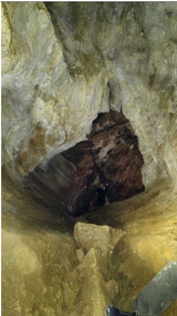
عکس شماره ۱: نمایی از داخل غار یخ مراد