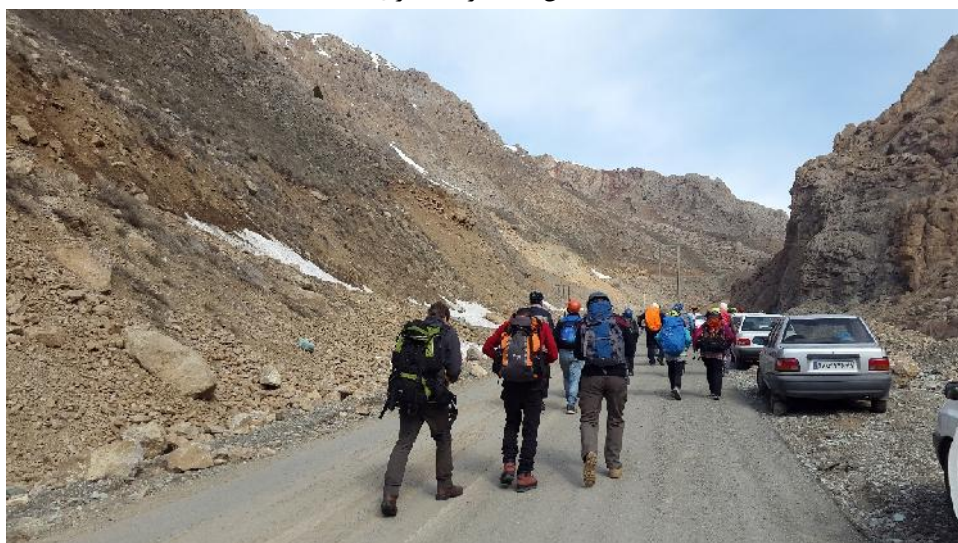
عکس شماره ۵: صبح، در مسیر رفتن به سمت غار- عکاس: صادقی پور